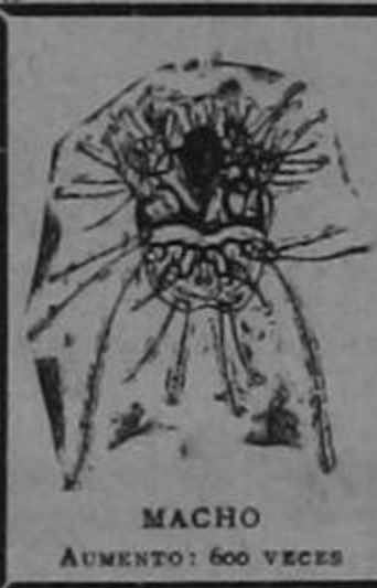
MACHO AUMENTO: 600 VECES

COMBATA ESA PICAZON O RASQUIÑA CON EL FAMOSO ACEITE VERDE